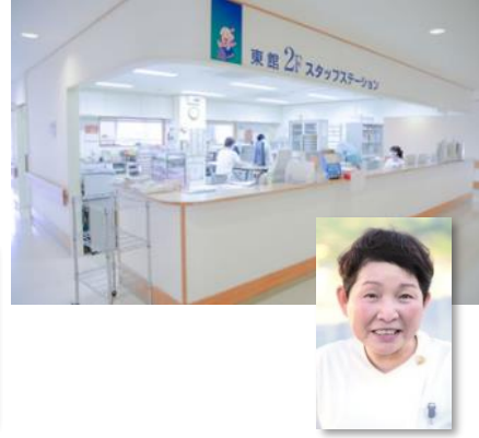
緩和ケア看護認定看護師