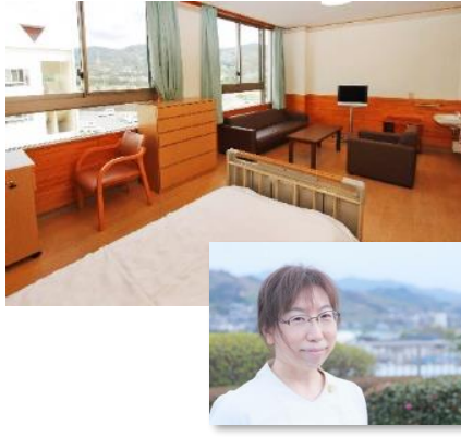
がん看護専門看護師