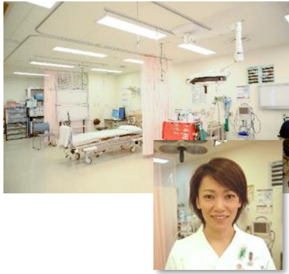
救急看護認定看護師