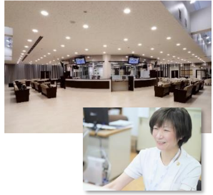
糖尿病看護特定認定看護師