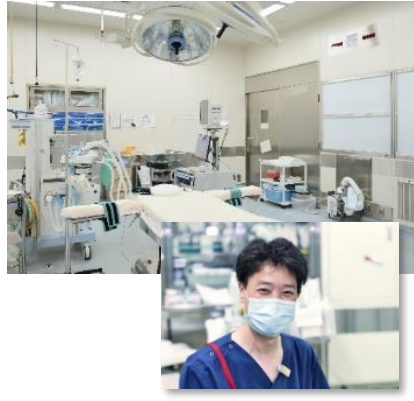
手術看護認定看護師